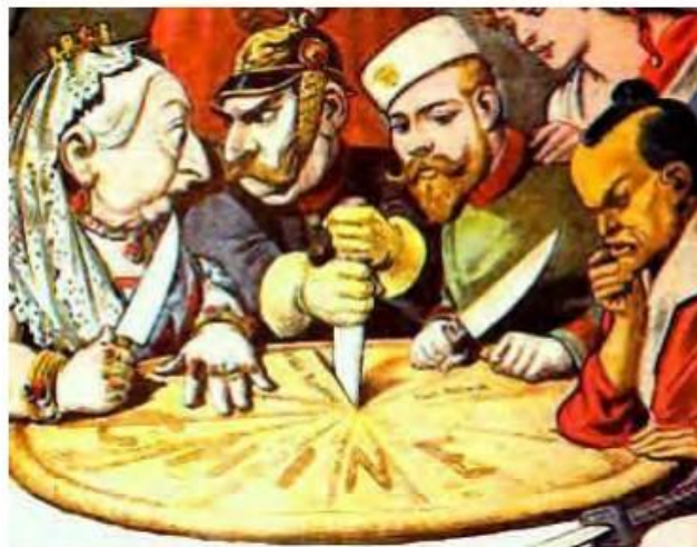
Caricatura que alude al intento de reparto de China por parte de gran Bretaña, Alemania, Rusia, Francia y Japón